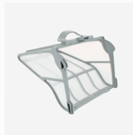
Filterbak Stevig, zeer fijn filter met grote inhoud (5 liter)